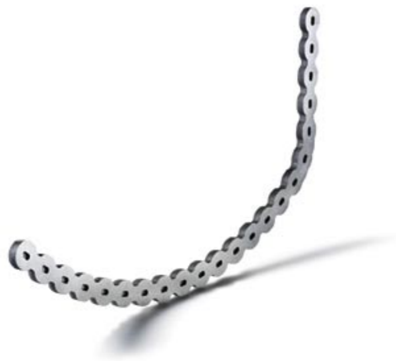
Rekonstruktions- und Traumaplatzen aus Titan für die Unfall- und die rekonstruktive Chirurgie.

Die Ansprüche an Medizinaltechnik-Produkte unterliegen einer dauernden Anpassung. Sowohl Anwender als auch Zulassungsbehörden stellen hohe Anforderungen. Tschudin + Heid verfügt über ein breites, fundiertes Know-how aus der Präzisionsmechanik. Unser Haupttätigkeitsgebiet ist die Fabrikation hochpräziser Qualitätsprodukte. Das erlangte Wissen setzen wir tagtäglich um in der Herstellung medizinischer Produkte im Auftrag unserer Partner. Wir verpflichten uns, unseren Kunden hochwertige, zuverlässige Teile für die Medizinaltechnik anzubieten. Selbstverständlich gehören dazu auch umfassende Dienstleistungen. Dies erreichen wir durch konsequentes Qualitätsmanagement über sämtliche Prozessstufen bis zur Auslieferung. Es ist das Bestreben von Tschudin + Heid, dem Kunden ein kompeten-