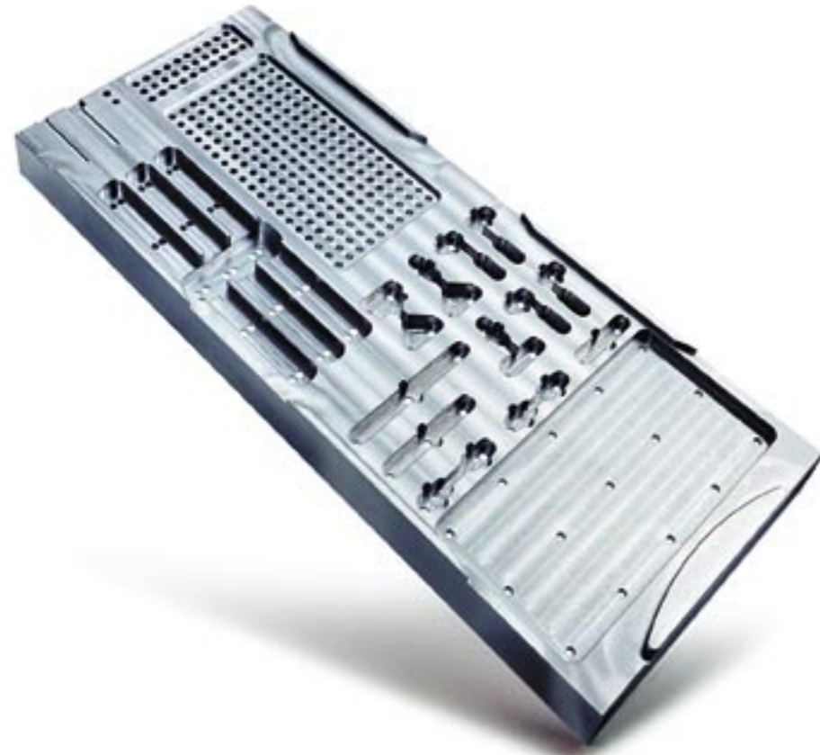
Aufbewahrungs- und Sterilisationscontainer für Implantate gemäss Ihren individuellen Wünschen und Bedürfnissen.